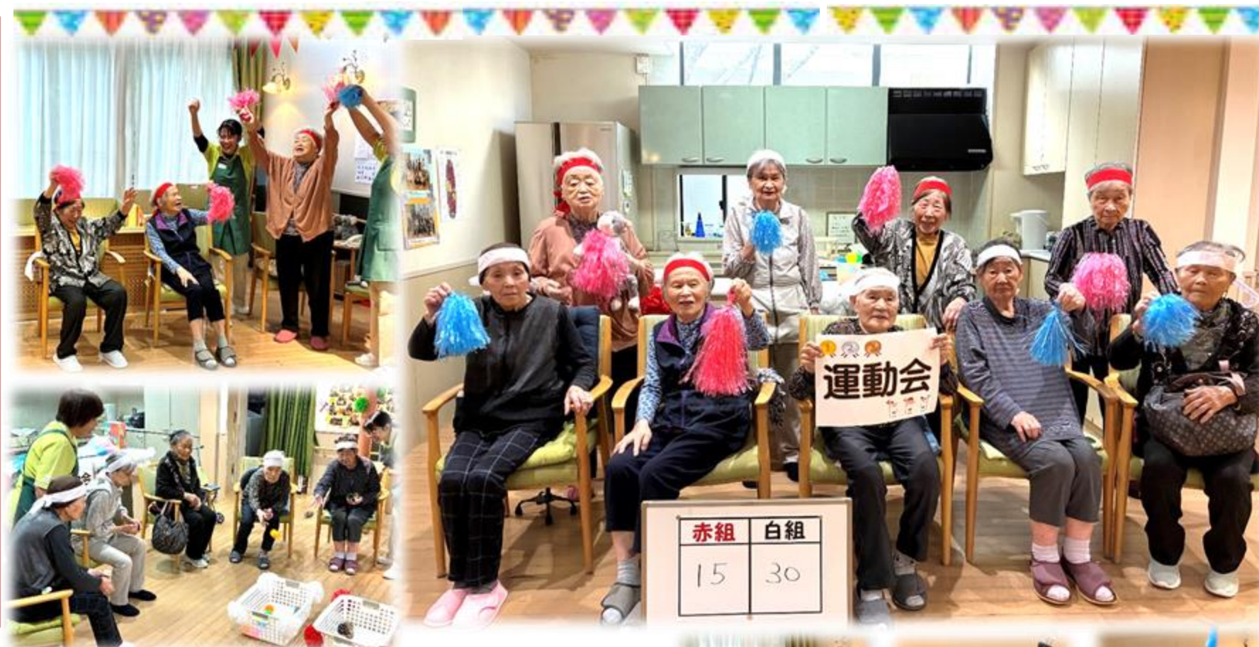
まどい運動会 11/4 いつもは仲良しの皆さん 玉入れにパン食い競争と、 は紅白に分かれて熱い戦い を繰り広げました。