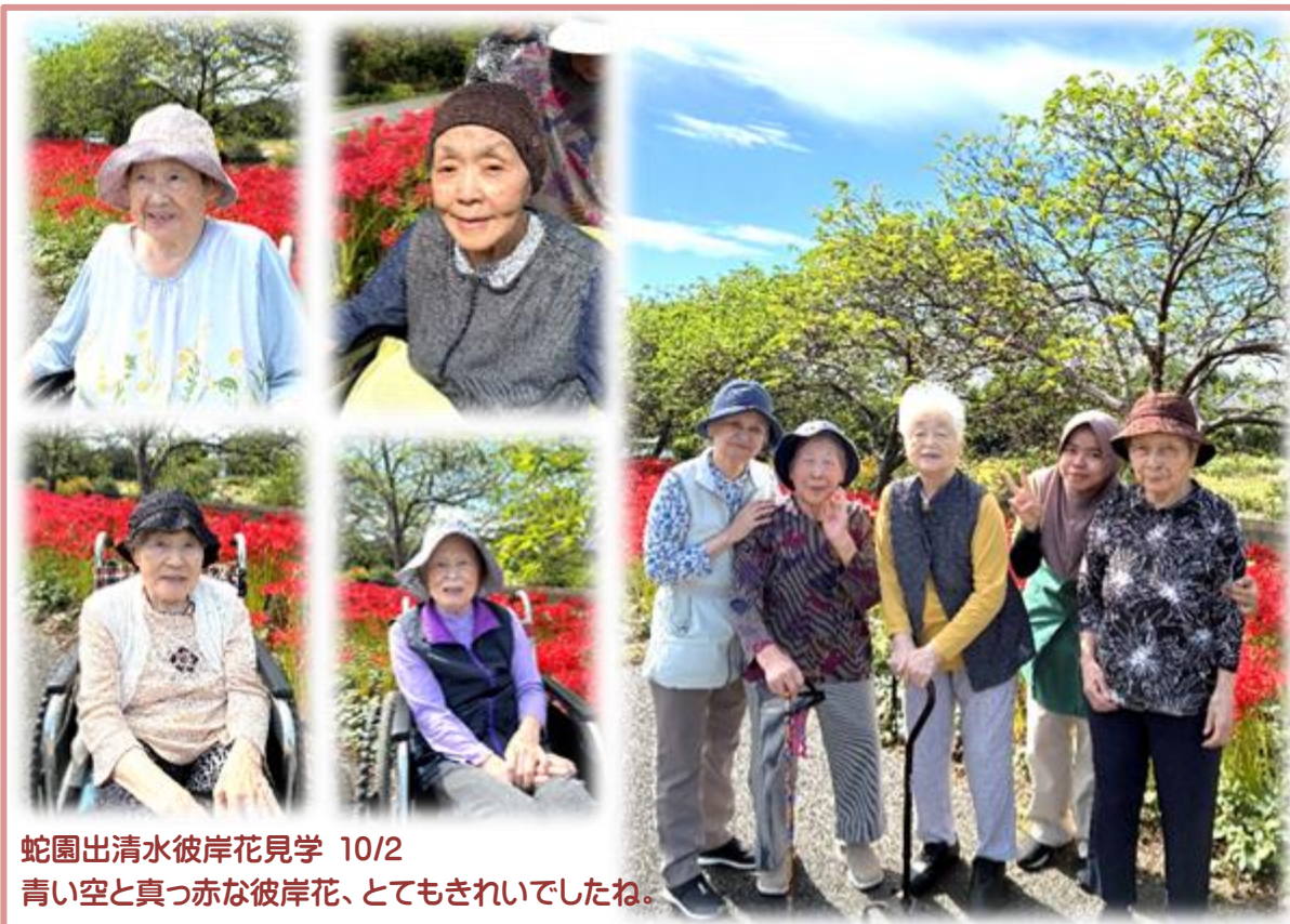
蛇園出清水彼岸花見学 10/2 青い空と真っ赤な彼岸花、とてもきれいでしたね。