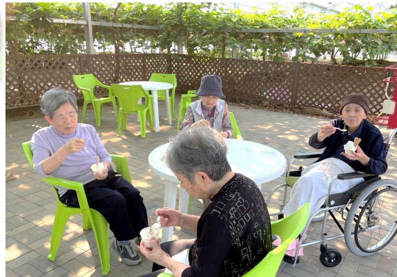
飯岡灯台・フルーツファーム向後 9月6日

まだいでは感染症に注意しながら、外出活動を行っています。入居者の皆様のご希望、ご要望に沿った外出も行っていきたいので、入居者の皆様の好きであったこと、好きであった場所等、教えていただくと助かります。施設の運営に関してもご意見、ご要望お聞かせください。よろしくお願いいたします。