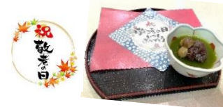
祝敬老 9月16日 いつまでもお元気でいてください。