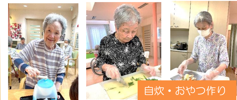
自炊・おやつ作り