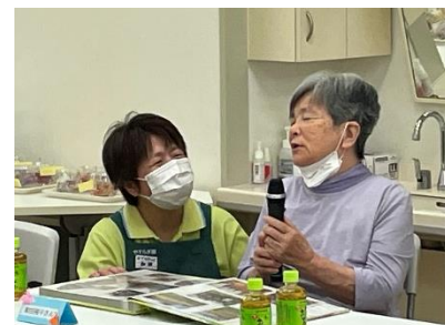
家族会 7月10日 アロマカップ作りを行いました。ご家族の皆さんと、楽しい時間を過ごしていただきました。