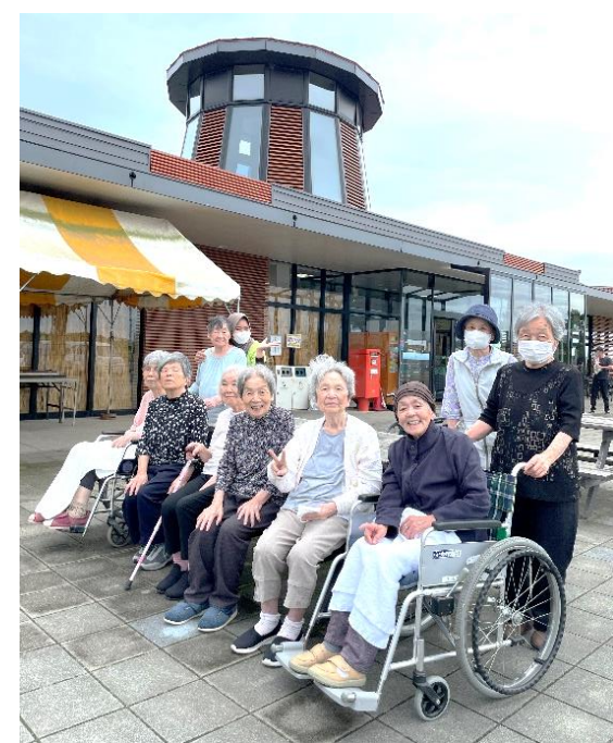
道の駅季楽里 9月6日