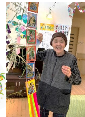
七夕飾り 7月7日 願い事がかないますように