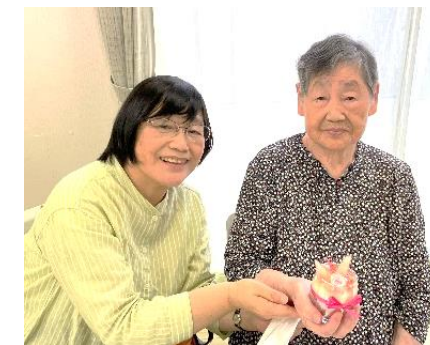
お誕生日おめでとうございます